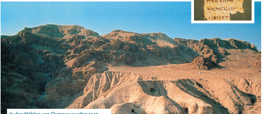
In den Höhlen von Qumran wurden 1947 zahlreiche Schriften aus der Bibel gefunden.